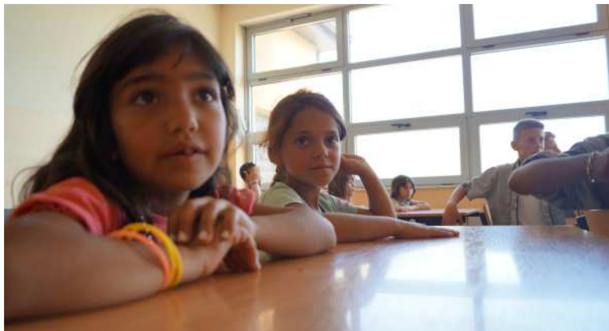
Clases de reforzamiento en Kosovo.