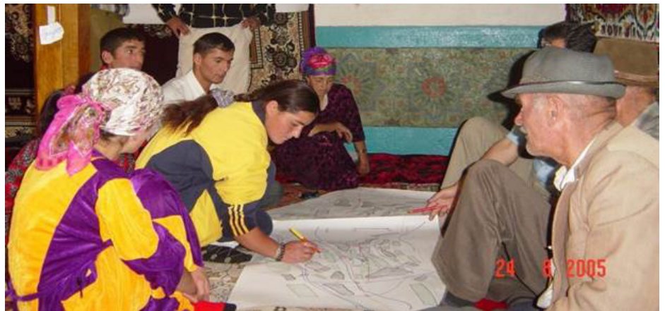
SDC, Participative village assessment, Tajikistan.

Une analyse de genre peut être effectuée à différents niveaux. Au niveau micro , l'accent est placé sur les femmes et les hommes, les ménages et les communautés. Ici, l'analyse devrait se concentrer sur la définition des rôles, des relations, des besoins et des priorités par rapport au contexte, ainsi que sur le poids des aspects culturels. Au niveau méso , l'accent se place sur les institutions. L'analyse porte sur le mode de fonctionnement des institutions en termes de fourniture et de mise en œuvre des services : disposent-elles de politiques et de compétences en matière de genre ? Les femmes et les hommes sont-ils traités sur un pied d'égalité ? Au niveau macro , ce sont les politiques et leur mise en œuvre dans les pays partenaires et au